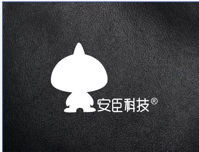
2、白色标志 特殊背景特殊纯色 (背景非白色) 使用 白色标志