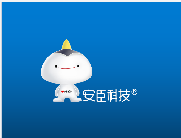
1、3D视觉效果 3D视觉效果优先使用