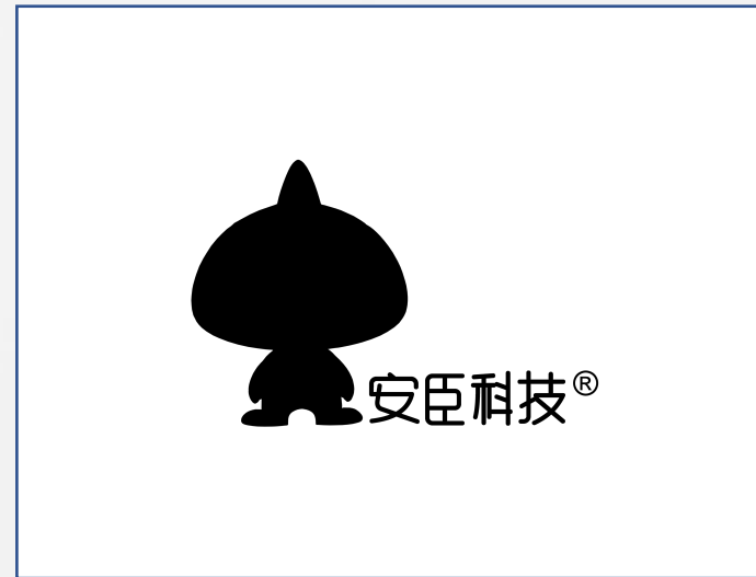
3、黑色标志 文件类及单色材料 (背景非黑色) 使用 黑色标志